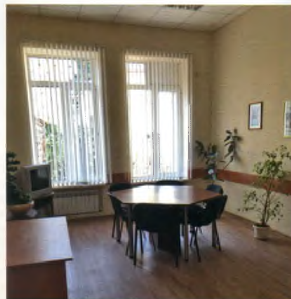
Комната примирения Азовского городского суда Ростовской области

Стороны спора самостоятельно по взаимному согласию выбирают для проведения процедуры